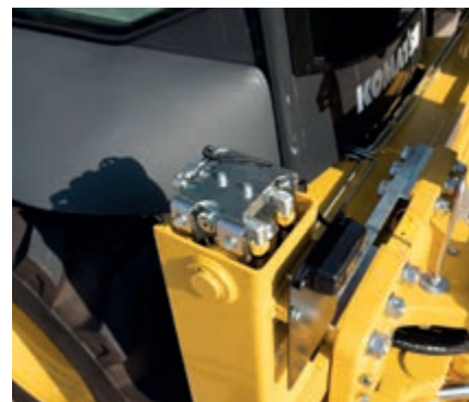
Valvole di sicurezza per stabilizzatori, braccio principale e avambraccio (di serie)