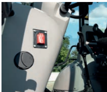
Interruttore secondario di spegnimento motore