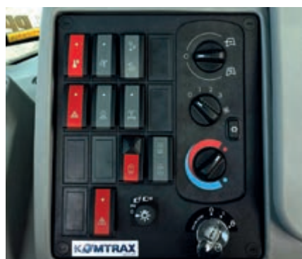
Pulsanti disegnati ergonomicamente