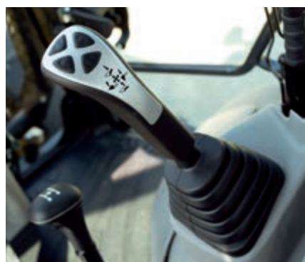
Comandi comodi, ergonomici e precisi

Un monitor LCD da 7" ad alta definizione assicura una visibilità eccellente. Il display LCD ad alta definizione è meno soggetto agli effetti dell'angolo di visualizzazione e della luminosità circostante, garantendo una visibilità ottimale. Vari allarmi e dati macchina sono visualizzati in un formato semplice. Vengono inoltre fornite informazioni utili come i dati storici di funzionamento della macchina, le sue impostazioni e i dati relativi alla manutenzione. L'operatore può navigare facilmente tra le schermate utilizzando intuitivi pulsanti laterali.