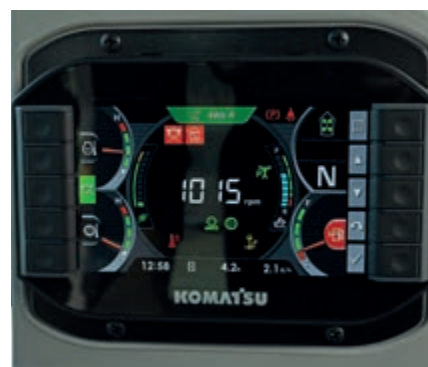
Nuovo monitor multifunzione da 7"