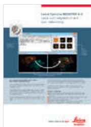
Leica Cyclone REGISTER