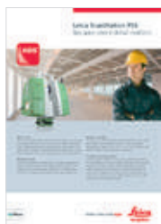
Leica ScanStation P16

Illustrazioni, descrizioni e specifiche tecniche non sono vincolanti. Tutti i diritti riservati. Stampato in Svizzera - Copyright Leica Geosystems AG, Heerbrugg, Svizzera, 2015. 832265it - 03.15 - INT