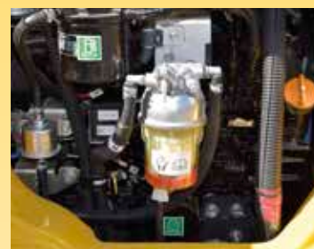
Grande filtro e prefiltro del carburante con separatore di acqua per proteggere il motore