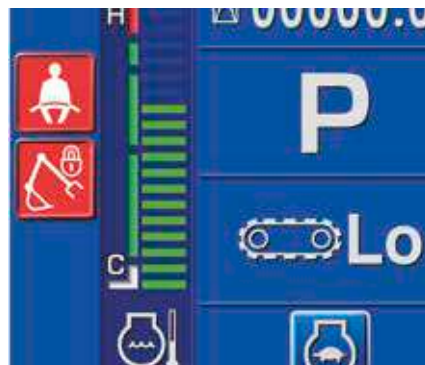
Avviso cintura di sicurezza e avviso impianto rilevamento posizione neutra