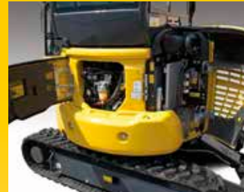
Cofani posteriori per controllo del motore, rifornimento carburante, ispezione e pulizia dei radiatori ed accesso alla batteria

L'adozione di connettori idraulici a faccia piana ORFS ed elettrici di tipo DT non solo aumenta l'affidabilità, ma rende più facili e rapidi eventuali interventi di riparazione. Boccole ad alta durabilità e un intervallo di 500 ore per la sostituzione dell'olio motore riducono ulteriormente i costi operativi.