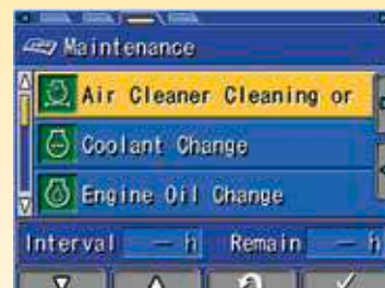
Monitor multifunzione per fornire all'operatore informazioni sullo stato di manutenzione