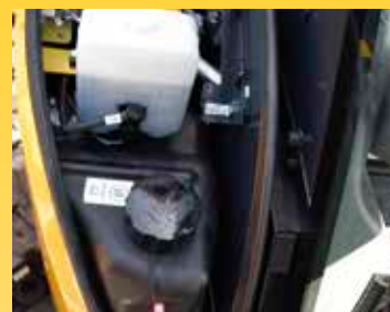
Rifornimento comodo e sicuro di olio e carburante sotto il cofano anteriore