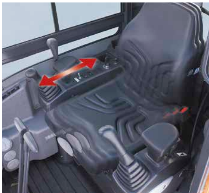
Sedile scorrevole confortevole

L'operatore ha a disposizione più spazio in cabina rispetto ad altri escavatori di questa categoria.