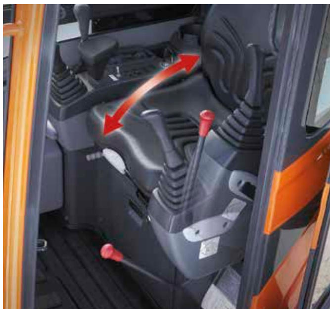
Funzione di inclinazione supporti di comando