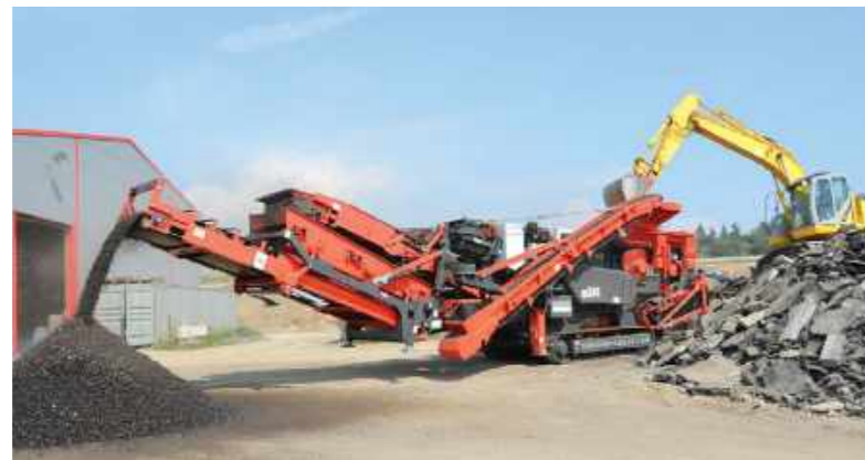
Disponibile con sistema di vaglio sospeso optionale