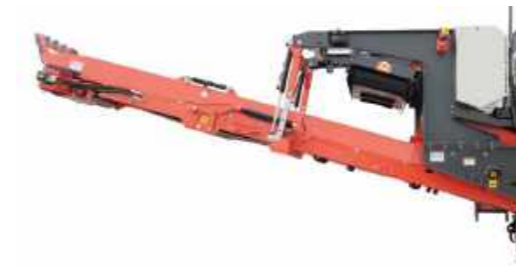
Sollevamento e abbassamento idraulico sul nastro principale