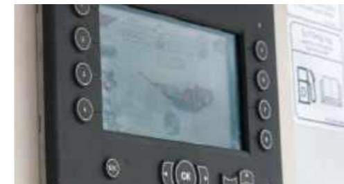
Pratico sistema di comando PLC e schermo a colori