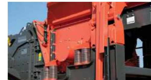
Pre-vaglio vibrante a due piani