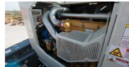
Facilità di manutenzione grazie al pratico accesso