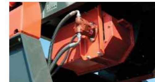
Alimentatore principale a vibrazione